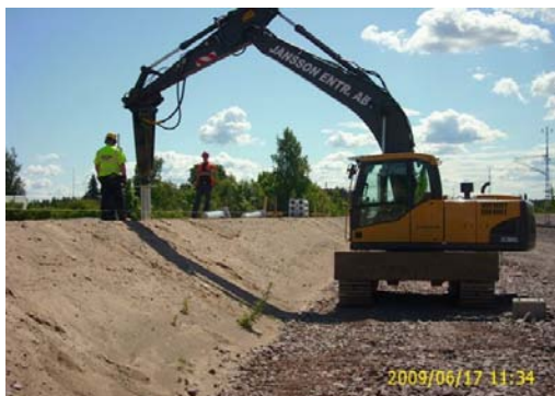
Palplanche en prélude à la construction de route.