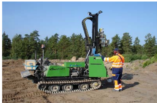
Travail géotechnique en prélude à la planification des espaces et la construction.