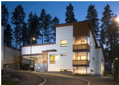
Mise en oeuvre de la construction de bâtiments, de routes, planification des terres et même de l'électricité.

Nous travaillons dans les differents moments appropriés par exemple des etudes, de la planification, la preparation des documents de construction et de l'exécution des travaux.